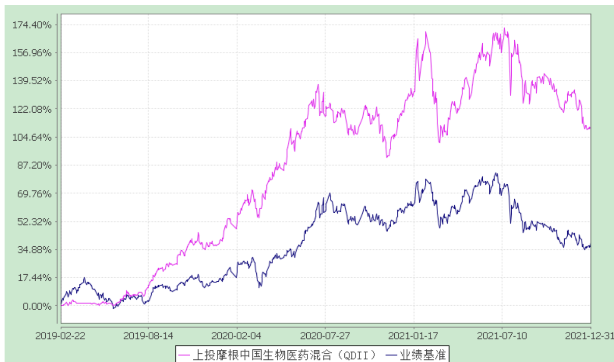
上投摩根中国生物医药混合型证券投资基金（QDII） 自基金转型以来份额累计净值增长率与业绩比较基准收益率历史走势对比图 (2019 年 2 月 22 日至 2021 年 12 月 31 日)

注：本基金合同生效日（转型日）为 2019 年 2 月 22 日，图示的时间段为合同生效日（转型日）至本报告期末。