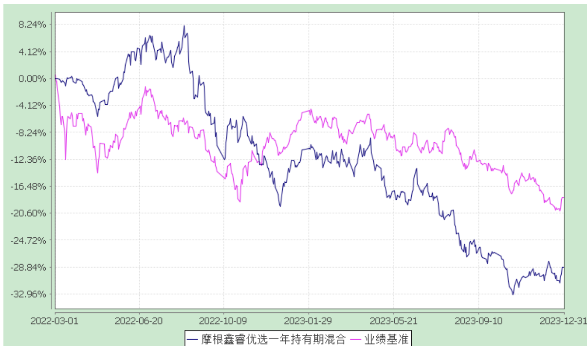
自基金合同生效以来份额累计净值增长率与业绩比较基准收益率的历史走势对比图 (2022 年 3 月 1 日至 2023 年 12 月 31 日)

注：本基金合同生效日为 2022 年 3 月 1 日，图示的时间段为合同生效日至本报告期末。