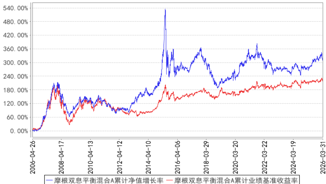
摩根双息平衡混合A累计净值增长率与同期业绩比较基准收益率的历史走势对比图