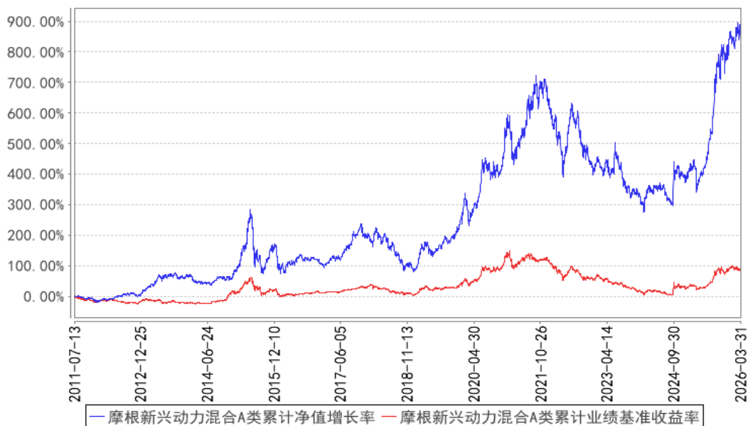
摩根新兴动力混合A类累计净值增长率与同期业绩比较基准收益率的历史走势对比图