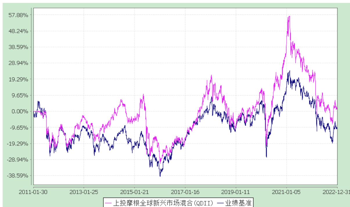
上投摩根全球新兴市场混合型证券投资基金 自基金合同生效以来份额累计净值增长率与业绩比较基准收益率历史走势对比图 (2011 年 1 月 30 日至 2022 年 12 月 31 日)

注：本基金合同生效日为 2011 年 1 月 30 日，图示的时间段为合同生效日至本报告期末。